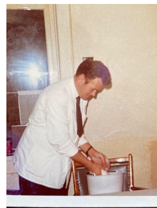
Weekendhulp in het oude Hebron

n Tiedje was e ook weekend hulp in n mannenpaveljoun, joa wis, in dij ôlle Hebron. As ook op t interne transport. Din mös e in de weekenden koffie en thee in grode roustvrij stoalen kitten rondbrengen bie de paviljounen. Klokje en Brakkie, dat wazzen zien traauwe pazzipanten. t Was in dij tied slim stoer om personeel te kriegen veur zuk soort weekend boantjes. Joa, dij jonge boeren zeun wos van aanpakken, dat haar e van hoes oet wel mit kregen.