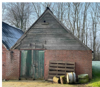
Ol Hebron nu, aangevreten door de tand des tijds

En aaltied is de naam 'Hebron' bleven. Den der stoan nog immer twij schuren bie boerderij Klaain Gommelbörg, n stainen schuur en Hebron. Wel wat aanvreten deur de taand van de tied, mor toch, ze stoan der nog. En zo hebben ze doar, dij aaltied wizzlende joargetieden van veule joaren overleefd, dij stainen schuur en 'Hebron' en op dag van vandoag worren ze nog aaltied zo nuimt.