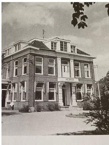
Het oude Hebron als statig oud Herenhuis

Dat was wis de juuste betaikenis veur dit gebaauw den der wazzen n een groep mannen in Hebron woonachtig en zai leefden door as n gemeenschap in verbondenhaaid en in vrede mit n kander. Het wazzen lû mit bepaarking en zwak van geest.