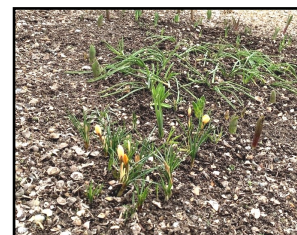
Vrijwilligers Oude Begraafplaats

De gemeente Eemsdelta is verantwoordelijk voor het onderhoud van de paden naar en rondom de begraafplaats. Ivm het vele onkruid is de gemeente dan ook verzocht om hier de noodzakelijke werkzaamheden aan te verrichten, zodat de begraafplaats op alle fronten er weer netjes uit ziet.